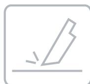
Resistencia a la abrasión