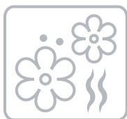
Inhibidor de olores