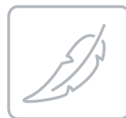
Suave y ligero